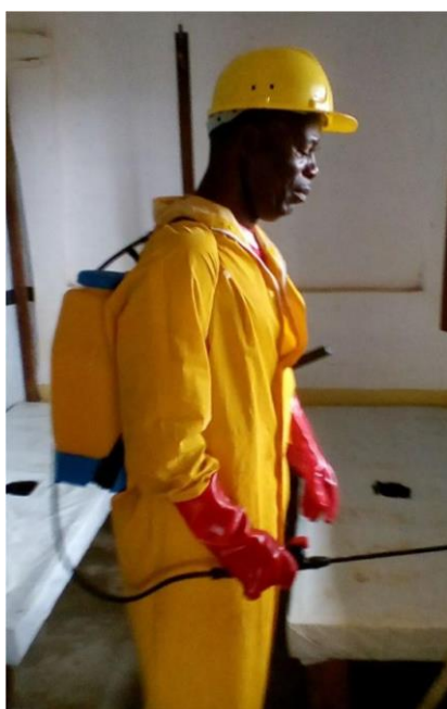
Désinfection de l'UTC à Brabanta par le superviseur du Médecins d'Afrique et les hygienistes