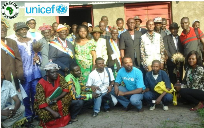
Lancement du Projet de Nutrition à assise communautaire dans 20 aires de santé de la zone de santé de Boko (Province du Kwango, RD Congo)

L'objectif général du projet est de contribuer à la réduction de la prévalence de la malnutrition chronique de 2% (45.6% à 43.6%) par la mise en œuvre des interventions à haut impact durant les 1000 premiers jours de la vie de l'enfant dans la zone de santé de Boko, province du Kwango d'ici à Fin Juin 2018. Il s'articule autour de 3 axes d'interventions: