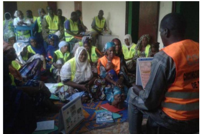
Renforcement de la circonscription socio-sanitaire de Talhaya en Mauritanie – MDA / ARTF / AJTD

Une partie des relais communautaires formés