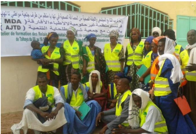
Renforcement de la circonscription socio-sanitaire de Talhaya en Mauritanie – MDA / ARTF / AJTD