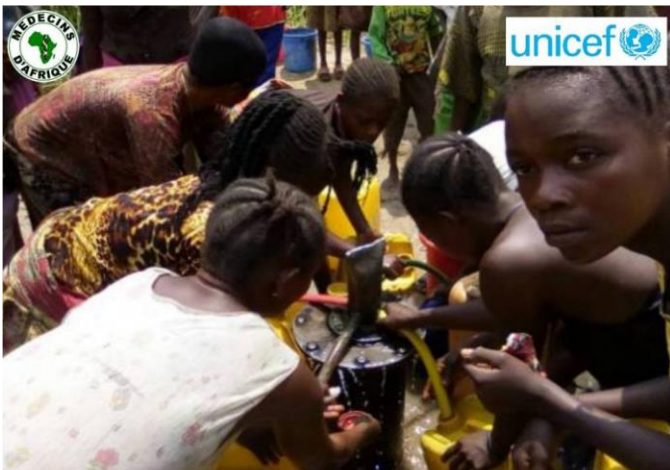
MEDECINS D'AFRIQUE Réponse d'urgence en Eau, Hygiène et Assainissement contre l'épidémie de choléra dans les zones de santé d'ILEBO, MIKOPE et MUSHENGE dans les Provinces du Kasai