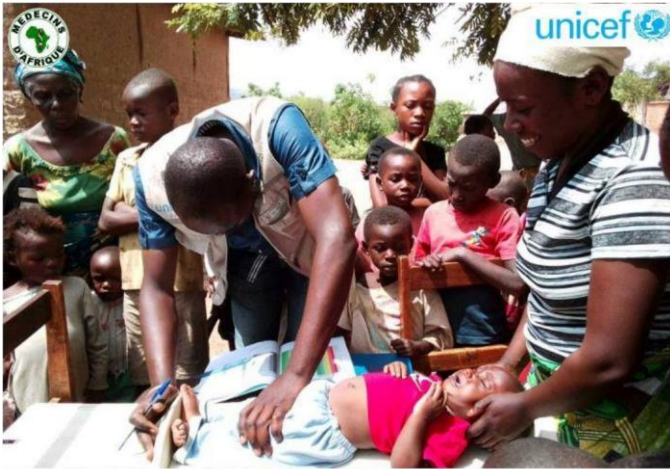
Appui à une Prise en Charge de Qualité de la Malnutrition Aiguë Sévère au Sud Kivu (RD Congo) - Janvier 2018

Ce projet, mené avec l'appui financier de l'UNICEF, vise à contribuer à la réduction de la morbidité et la mortalité dues à la malnutrition par l'amélioration de la qualité de la prise en charge des enfants malnutris aigus sévères dans les UNTI et UNTA des zones de santé de Kabare, Katana, Kalehe, Miti- Murhesa, Mubumbano, Minova et Uvira dans la province du Sud Kivu. Il s'articule autour de 3 axes de travail :