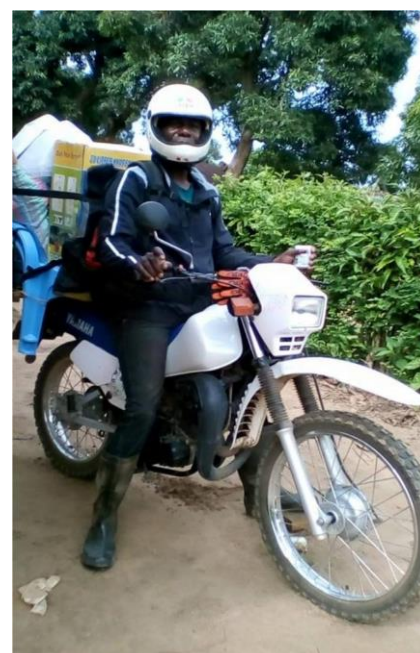
En route pour combattre l'épidémie de choléra dans plusieurs zones de santé du Kwilu et du Mai ndombe.