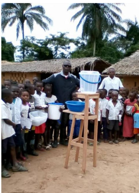
Remise du kit de lavage des mains aux élèves de l'EP BASONGO dans la province de Kasai par Médecins d'Afrique