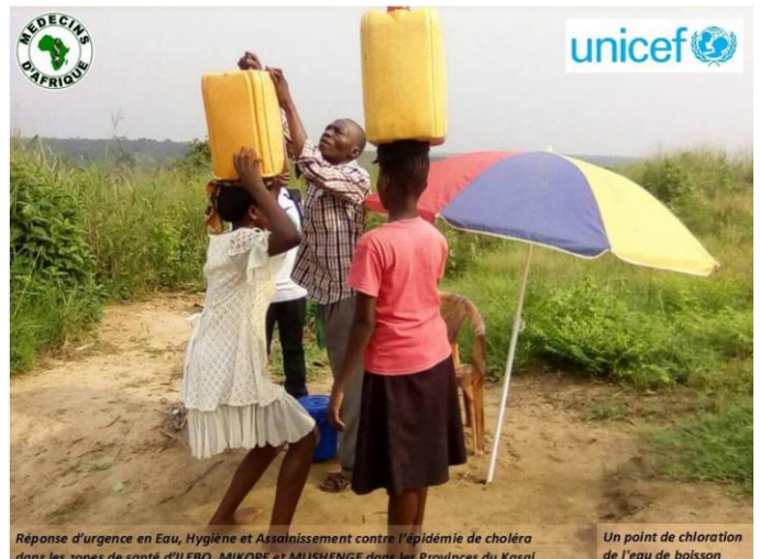
MEDECINS D'AFRIQUE Réponse d'urgence en Eau, Hygiène et Assainissement contre l'épidémie de choléra dans les zones de santé d'ILEBO, MIKOPE et MUSHENGE dans les Provinces du Kasai