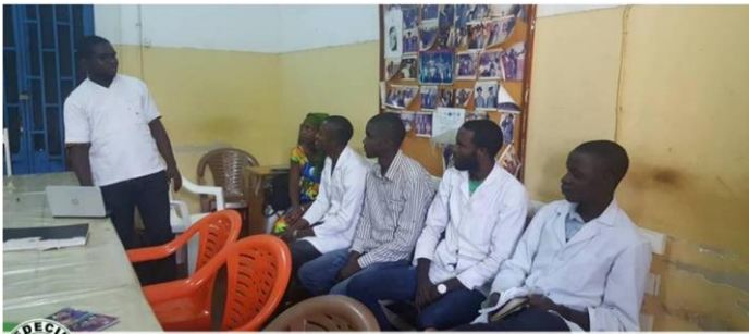
MEDECINS D'AFRIQUE Sensibilisation de proximité dans les ménages, écoles et centres de santé de Conakry pour une meilleure connaissance et prévention du choléra