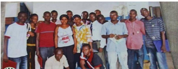
MEDECINS D'AFRIQUE Sensibilisation de proximité dans les ménages, écoles et centres de santé de Conakry pour une meilleure connaissance et prévention du choléra